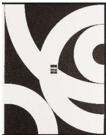
Max Bill Ohne Titel, 1942 Linolschnitt / Linocut 27 × 20.7 cm (Blattgrösse / Sheet size: 27 × 42 cm) Fondazione Marguerite Arp, Locarno