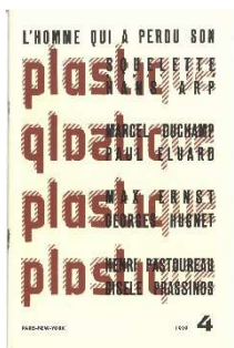
Plastique Plastic Nr. 4 hrsg. v. Sophie Taeuber-Arp, Paris / New York, Winter 1939 Zeitschriftencover: Lithografie und Hochdruck / Magazine cover: Lithography and letterpress, 42.2 x 15.7 cm Fondazione Marguerite Arp, Locarno