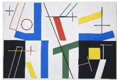
Sophie Taeuber-Arp Six chambres, 1932 Gouache und Bleistift auf Papier / Gouache and pencil on paper 45.5 x 59 cm (Rahmenmass) Fondazione Marguerite Arp, Locarno