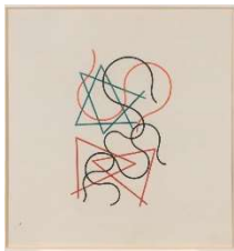
Sophie Taeuber-Arp Lignes géométriques et ondoyantes, 1941 Farbstifte auf Papier / Colour pencils on paper 32 × 30.5 cm Fondazione Marguerite Arp, Locarno